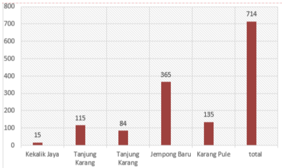
Grafik 2. Daftar Kasus Stunting di Kelurahan/Kecamatan Sekarbela

diantara puskesmas lainnya yang berada di Kelurahan Kota Mataram. Data detail kasus stunting di Desa/Kecamatan Sekarbela dapat dilihat pada tabel di bawah ini: