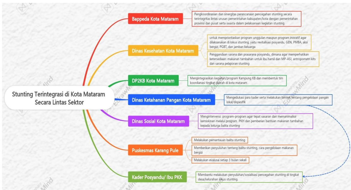
Gambar 4. Alur Tahapan Proses Kolaborasi Implementasi Kebijakan Percepatan Pencegahan Stunting Terintegrasi Dengan Beberapa Organisasi Perangkat Daerah Lintas Sektor di Kota Mataram Menggunakan Edwarpap (2023).

Jadi, berdasarkan Peraturan Gubernur Nusa Tenggara Barat Nomor 68 Tahun 2020 tentang Aksi Pencegahan dan Percepatan Penurunan Stunting Terintegrasi, di Kota Mataram proses implementasi kebijakan stunting dilakukan secara terintegrasi dengan beberapa OPD lintas sektor terkait, berikut dokumen berisi alur tahapan proses kolaborasi implementasi kebijakan percepatan pencegahan stunting terintegrasi dengan beberapa OPD lintas sektor di kota mataram.